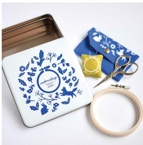
▲ 裁縫セット。缶と同デザインのポーチと針山も。