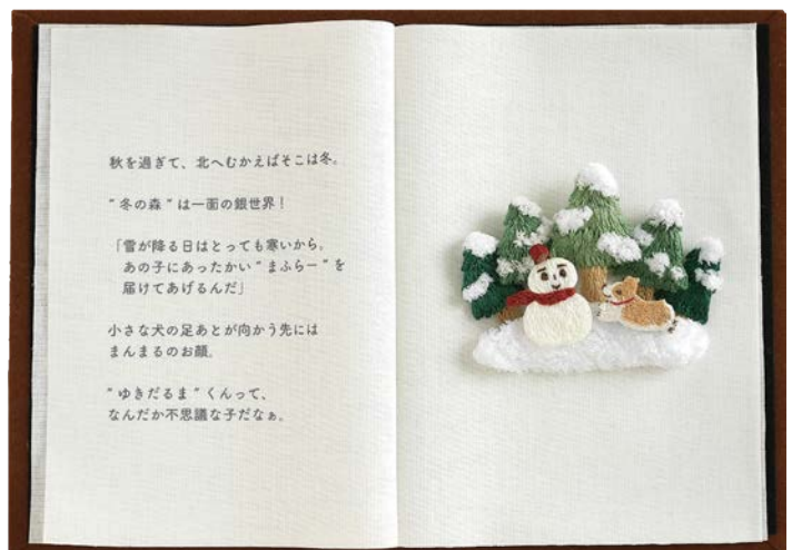
▲ 刺しゅうの世界「糸の森」に生まれたこぎつねが、季節の森をめぐる、ヒトの世界につながっていく。物語風の連作。