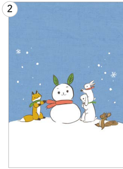
② カラーラフで全体の色の確認