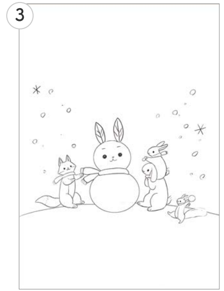
③ 刺しゅう作業用に線画を書きおこす