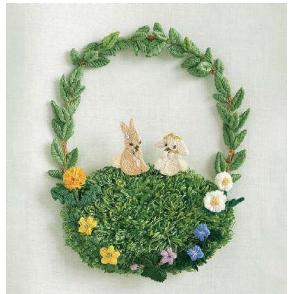
▲ 2022年開催 初個展「いとしのもりのものがたり」メインビジュアル