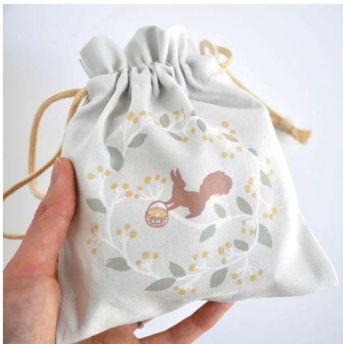
▲ お菓子とデリのブランド「ar*」とのコラボレーション巾着 ▼ 巾着デザインにあわせたクッキー型のデザインも制作。