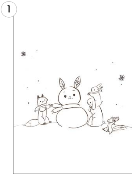
① ざっくりとしたラフイメージの作成