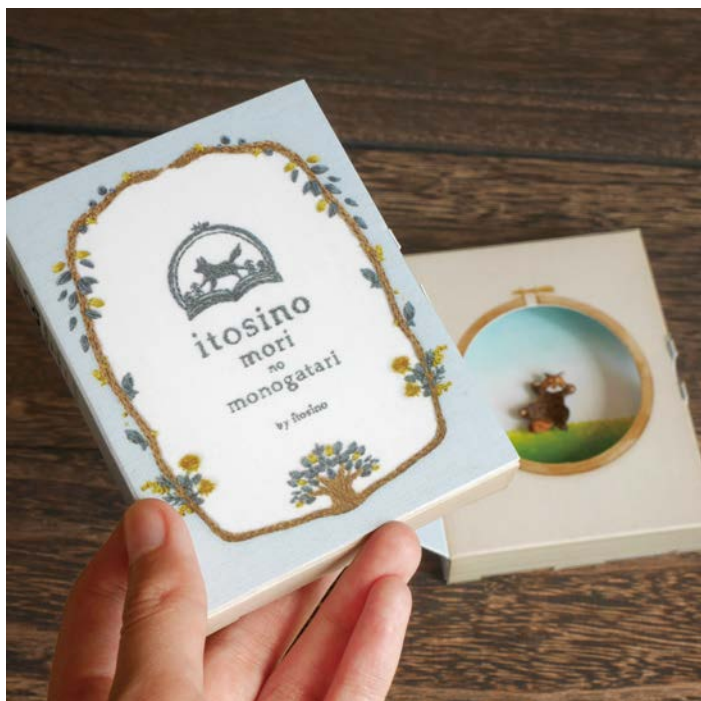
▲ 箱の形状からデザインした本型のブローチ用パッケージ。