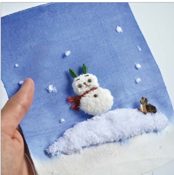
④ パーツごとに刺しゅうを制作し、撮影