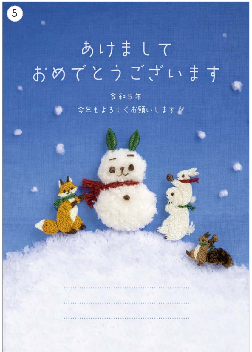
⑤ PC上(Photoshop)で色味や細かい配置などを整え、文字を入れて完成